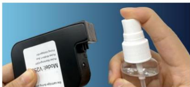
Dysza do czyszczenia płynu czyszczącego