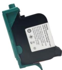
Zamontuj zacisk ssący i mocno zaciśnij